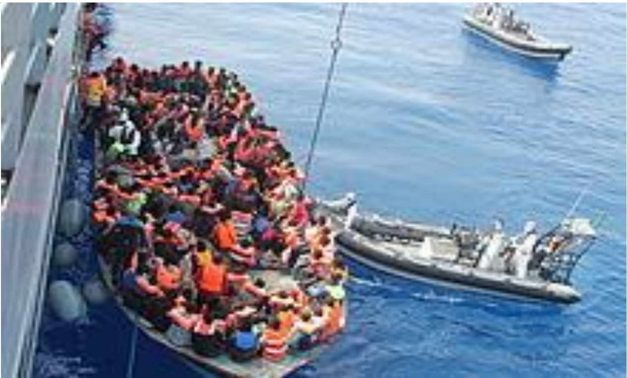
Figura 1.3: operazione di salvataggio Triton