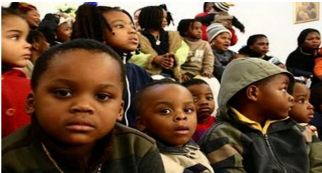
Figura 2.1 : minori stranieri non accompagnati (MSNA)