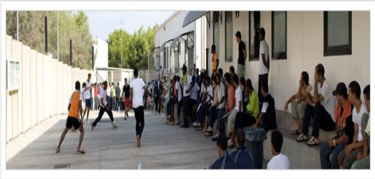
Figura 6.2: accoglienza in centro hub

nel cosiddetto programma di reclusione (siriani, iracheni, eritrei, che dovrebbero andare nei paesi dell'UE secondo una serie di quote) sia di tutti gli altri.