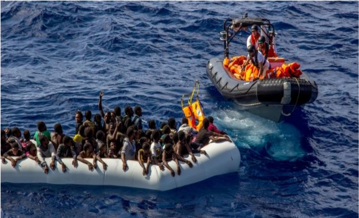
Figura 1.4: Salvataggio migranti in barcone.