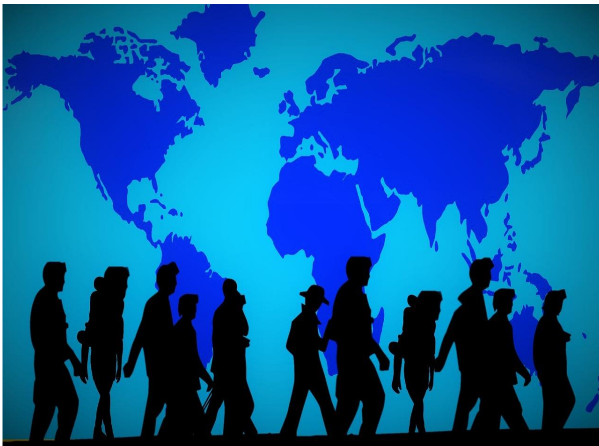
Figura 1.2: Nel mondo 244 milioni di migranti su una popolazione di oltre 7 miliardi di persone

Fonte: I migranti forzati e non aumentati del 41% da inizio secolo, secondo i dati dell' International Migration Report 2015 delle Nazioni Unite analizzato dal sole 24 Ore. 21