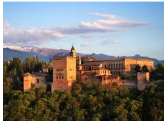
16. Granada: la Alhambra