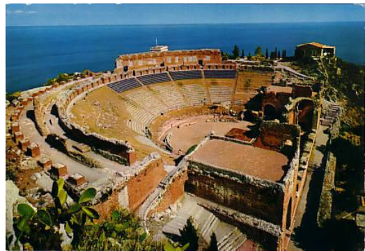
12. Taormina: l'Anfiteatro greco