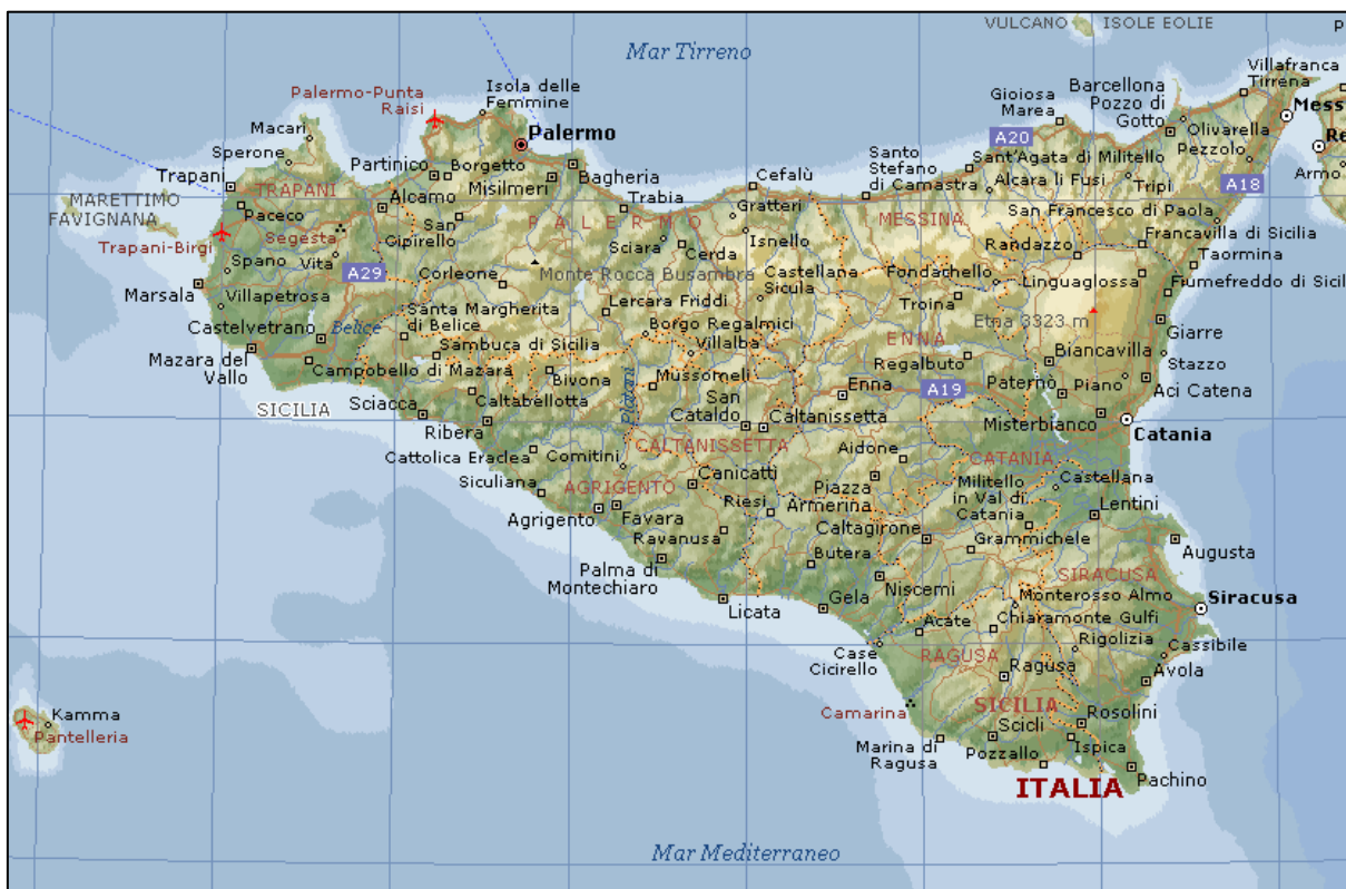
2. Carta Geografica della Sicilia

Negli ultimi anni si è assistito ad un lento, ma progressivo miglioramento delle condizioni dell'Isola, anche se la strada da percorrere per arrivare ad un completo sviluppo è ancora lunga.