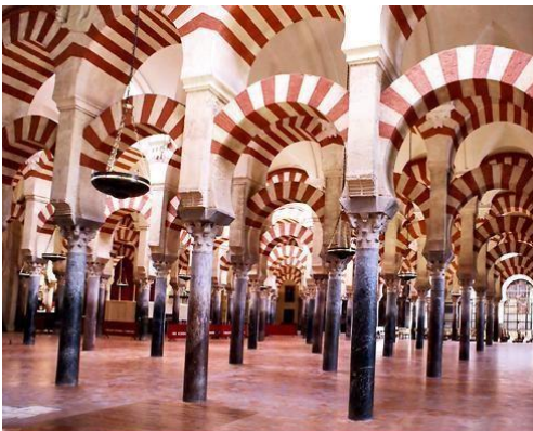
15. Córdoba: interno della Mezquita