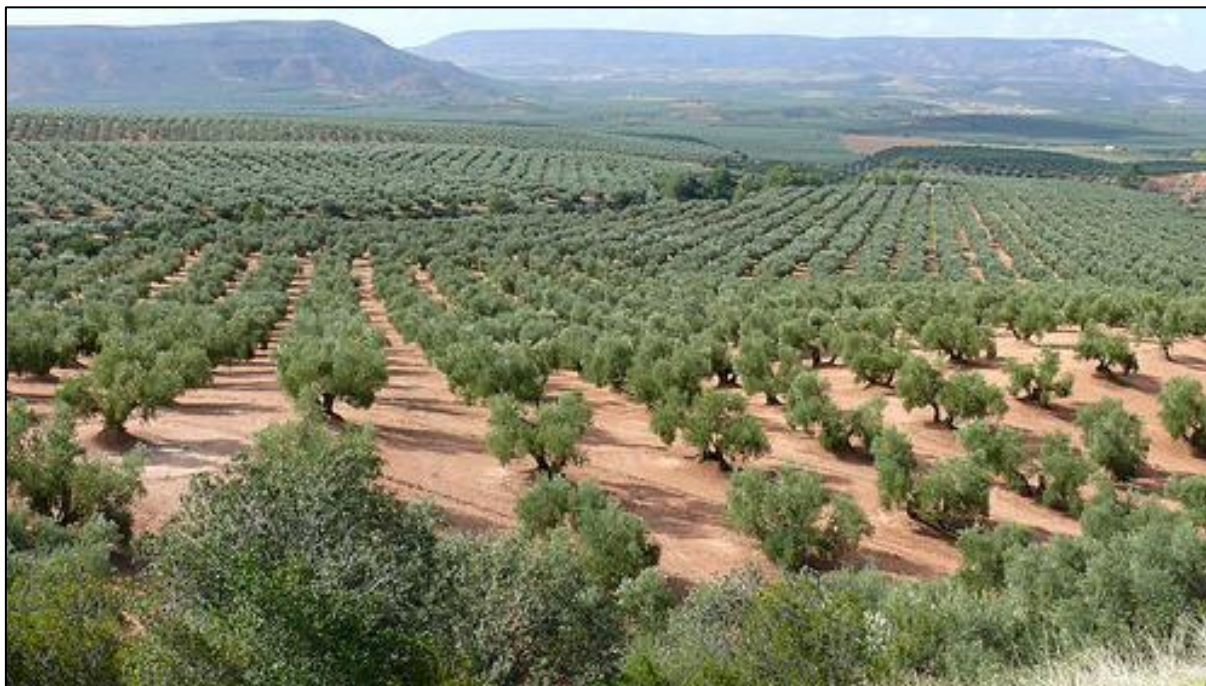
8. Coltivazione di olivi nella zona di Jaén

Se da un lato si può quindi affermare che negli ultimi decenni ci fu un netto miglioramento della situazione economica dell' Andalucía , dall'altro è necessario mettere in evidenza come ancora oggi la regione stia soffrendo a causa dell'altissimo tasso di disoccupazione, dei bassi salari e dei pochi investimenti fatti dal governo centrale volti ad impulsare il rinvigorismento di tutto l'apparato economico andaluso.