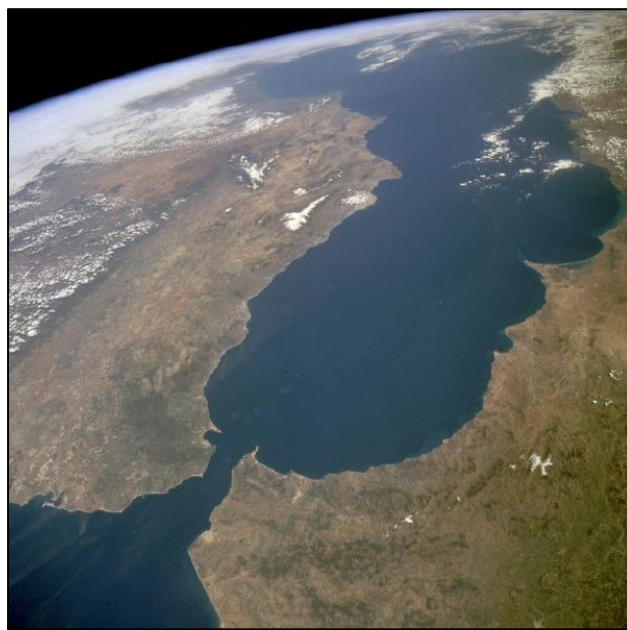
5. Foto satellitare della vicinanza tra Andalucía e Marocco

Questa organizzazione punta soprattutto ad un miglior conoscenza del fenomeno dell'immigrazione dal Nord Africa all'Andalucía e delle sue ripercussioni in ambito sociale, economico, giuridico, così come alla sensibilizzazione sociale, cercando di eliminare qualsiasi forma di razzismo, xenofobia e discriminazione di ogni tipo. 280