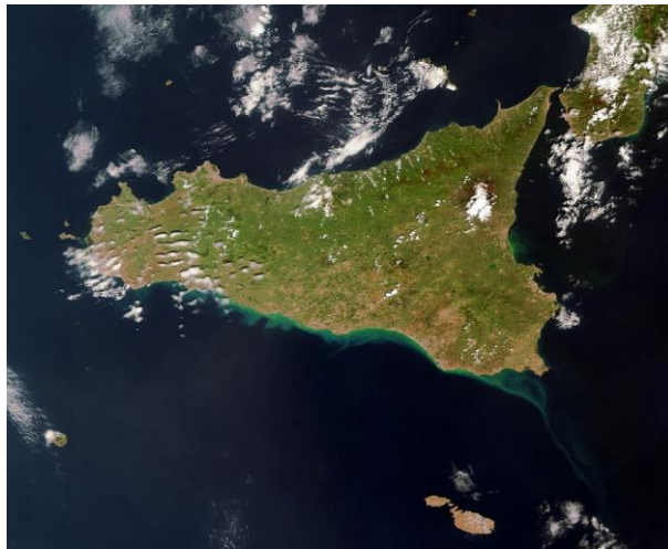
6. Foto satellitare dell'isola di Sicilia

asilo, grazie alle elargizioni del Programma Operativo Nazionale di Sicurezza 290 ), sono stati fatti degli interventi integrativi per favorire la multiculturalità all'interno delle scuole, per avviare corsi di lingua italiana, oltre ad essersi moltiplicati i centri polifunzionali volti a favorire l'inserimento degli stranieri nel mercato del lavoro. 291