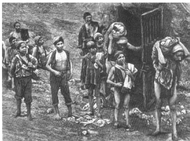
7. Carusi all'ingresso di una zolfara (litografia di E. Ximenes)

Per quanto riguardava poi la popolazione, ancora per tutto l'Ottocento essa mantenne una struttura piramidale, suddivisa su tre livelli: al vertice l'aristocrazia terriera, che sperperava i propri patrimoni nella corsa al lusso ed allo sfarzo; poi la borghesia i cui membri spesso tentavano di imitare il tenore di vita dei nobili e di entrare a far parte della loro classe sociale; ed infine il popolo che versava in un generale stato di miseria, d'ignoranza e di arretratezza. Furono proprio il basso tenore di vita della maggior parte della popolazione, assieme alla scarsità del denaro circolante, che nel lungo termine impedirono l'affermarsi di qualsiasi attività produttiva.