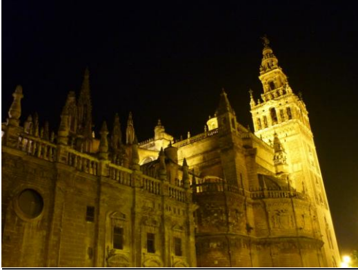
13. Sevilla: la Giralda