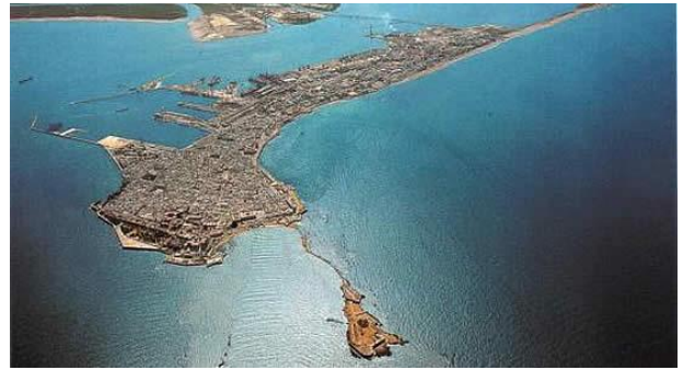
14. Cádiz: prospettiva aerea