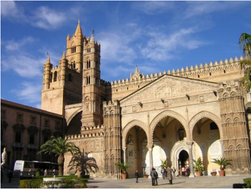
9. Palermo: il Duomo