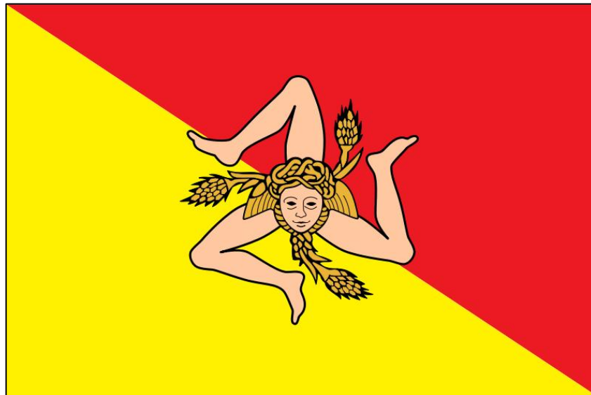
1. Bandiera della Sicilia

In realtà il nome deriva dalla radice indogermanica Sik , che significa crescita, ingrossamento. In greco antico si ricorreva a questa radice per individuare alcuni frutti che si sviluppavano rapidamente come il fico ( siké ) o la zucca ( sikús ). Da qui il nome Sicilia assumerebbe il significato di “Terra della fecondità”. Durante l’occupazione bizantina (sec. VI – IX) si pensava che Sicilia derivasse dall’unione di due parole greche ( siké ed elaia ), che si riferivano a due piante caratteristiche dell’isola: il fico e l’olivo.