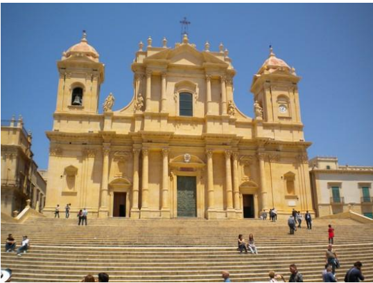
11. Noto: il Duomo