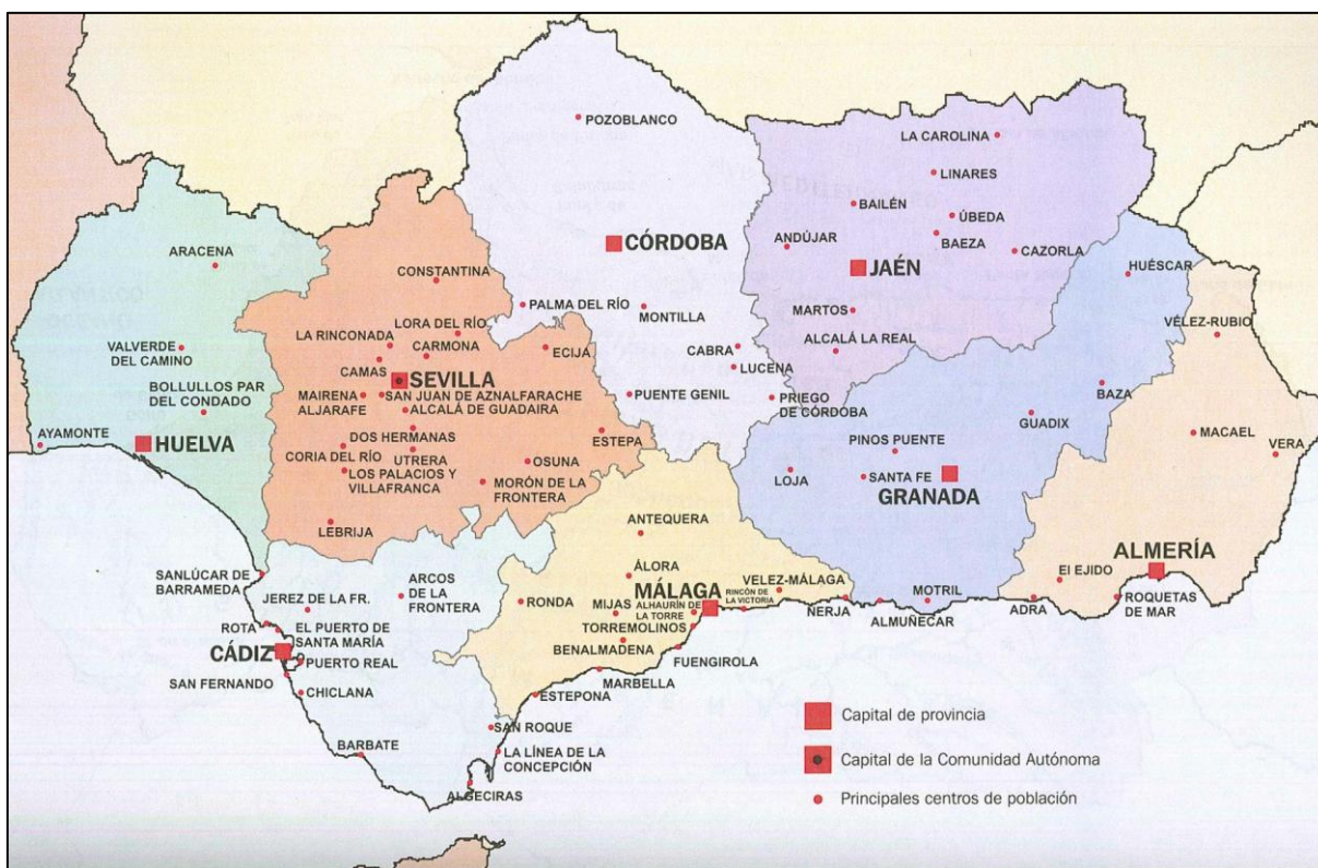
4. Carta Geografica politica dell'Andalucía

Malgrado i passi avanti che sono stati fatti per lo sviluppo della regione e per il miglioramento delle condizioni di vita dei suoi abitanti, al momento attuale continuano a persistere nel suo territorio sacche di povertà, un livello di disoccupazione tra i più alti rispetto a quelli delle altre regioni del Paese, un latente sottosviluppo economico ed altri problemi più o meno gravi. Tuttavia, sebbene il quadro attuale non sia dei più rosei, gli andalusi non si danno per vinti e continuano a lottare per poter rilanciare ed innovare la loro regione che per secoli è stata il cuore pulsante dello Stato.